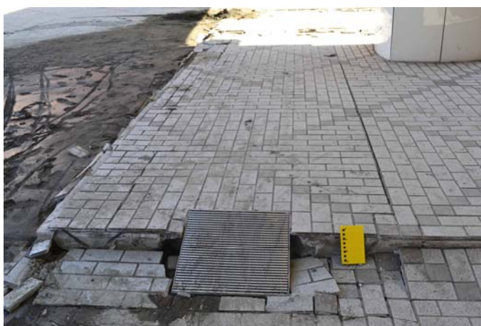
7 JR 海浜幕張駅前歩道のギャップ 駅前の歩道と道路の境目から大量の土砂が噴出し、 地盤が沈下、歩道との間にギャップが生じた。