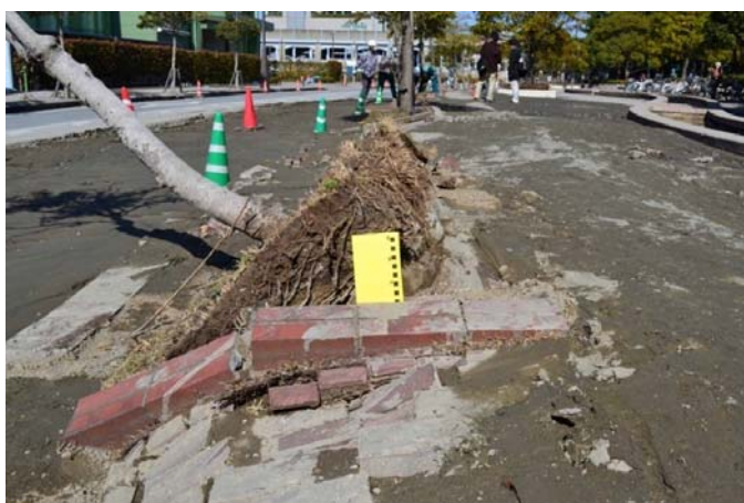
5 幕張海浜公園外周道路沿いの街路樹植栽の被害 歩道脇の街路樹も植栽柵ごと持ち上げられ、倒れた。 歩道脇に埋められた汚水柵にも大きなズレが生じた。