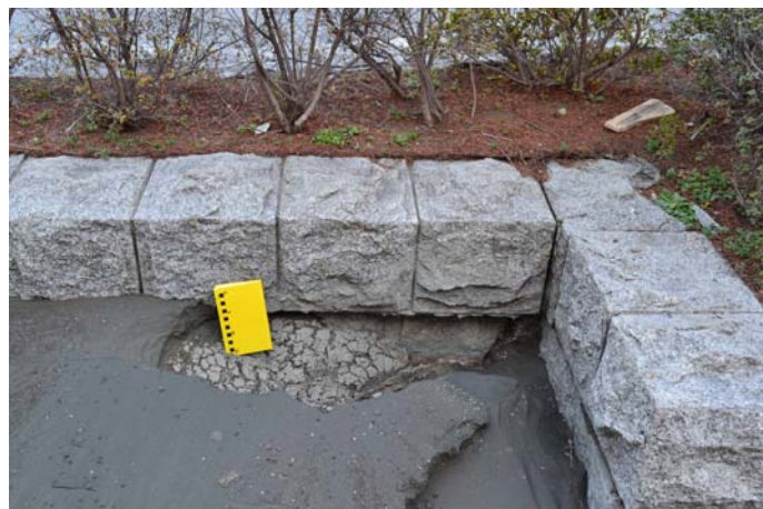
8 JR 海浜幕張駅前歩道の植込み脇の噴砂口 植栽柵などの構造物の脇から噴砂が起こり、大量の 暗灰色の泥状の細砂が地表に堆積した。 2011.3.13