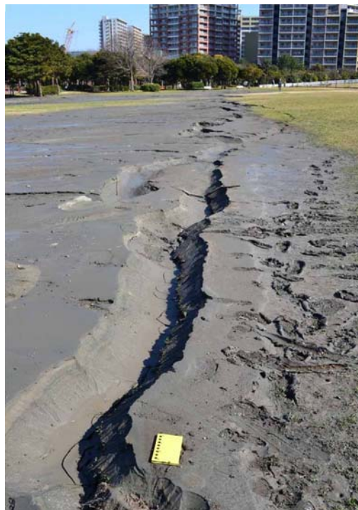
2 千葉市幕張海浜公園の液状化被害 亀裂に沿って大量の暗灰色の泥状細砂が噴出した。