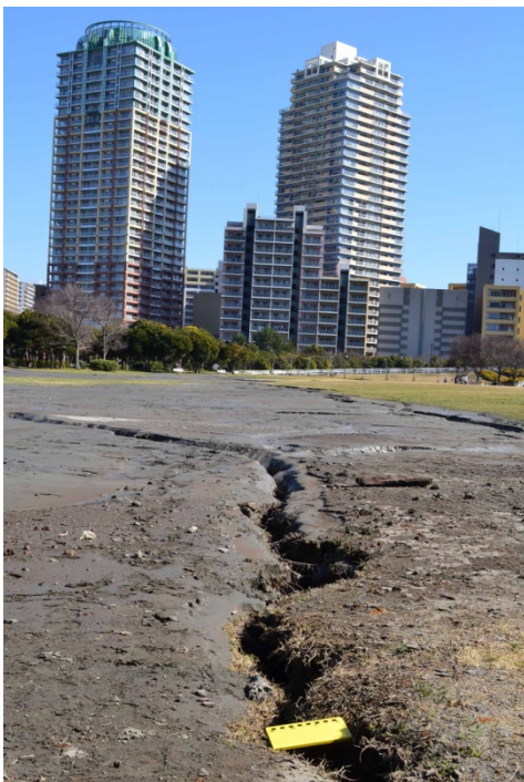
1 千葉市幕張海浜公園の液状化被害 亀裂は芝生広場をほぼ縦断。黄色は 15cm 野帳