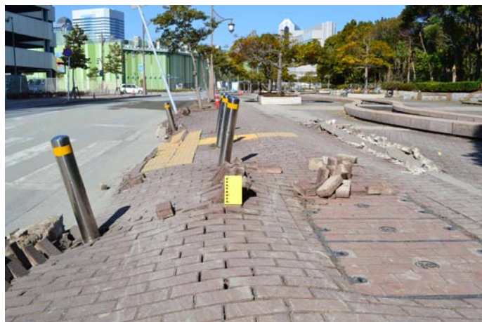
4 幕張海浜公園外周道路沿いの歩道の被害 インターロッキングが立ち上り、波打ち、車止も傾いた。