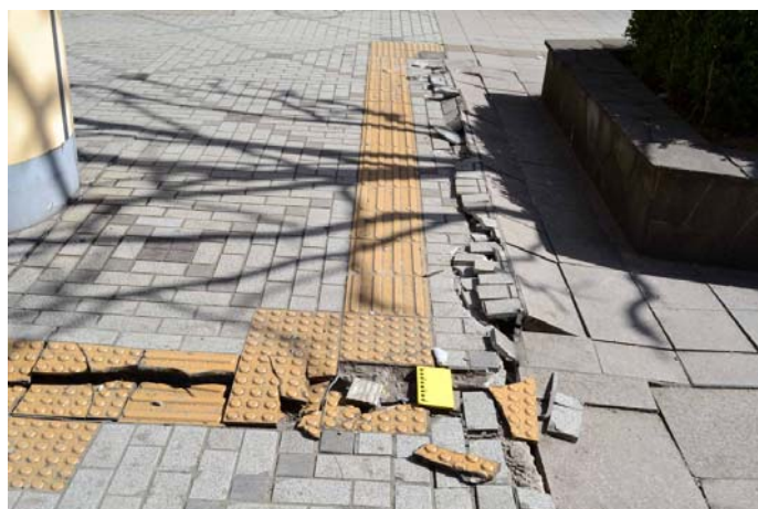
6 JR 海浜幕張駅前歩道に生じた亀裂 人通りの多い、駅前歩道空間にも亀裂が生じた。