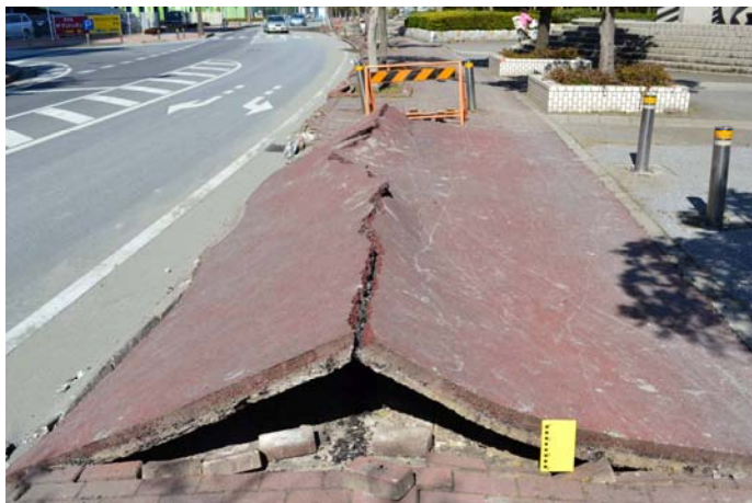
3 幕張海浜公園外周道路沿いの歩道の亀裂 コンクリート歩道では亀裂が生じ、持ち上がった。 道路との間の縁石も破損した。